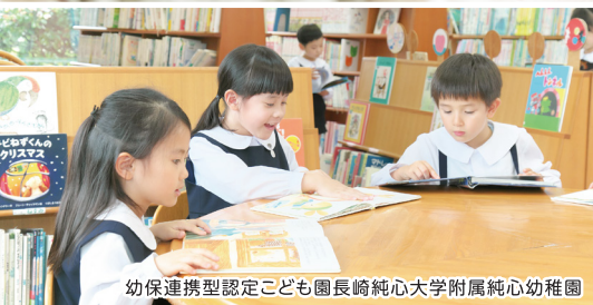
幼保連携型認定こども園長崎純心大学附属純心幼稚園