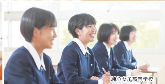
純心女子高等学校

長崎純心女子学園 リサイクル募金は、皆様から読み終えた本・DVD・ブランド品等をご提供いただき、その査定換金額が学校法人純心女子学園に寄附される取り組みです。寄附金は「純心マッチ基金」寄附事業に充当し、学術研究支援、学生生徒の就学支援、教育研究環境充実整備に役立てられます。皆様からのご支援、ご協力をお待ちしております。